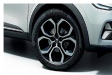
Jante aliaj 18", design Pasadena (RALU18/RDIF09)