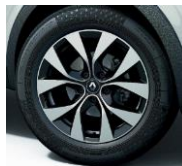
Jante aliaj 17", design Bahamas (RALU17/RDIF08)