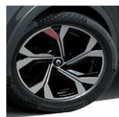
Jante aliaj 18", design RS Line (RALU18/RDIF13)