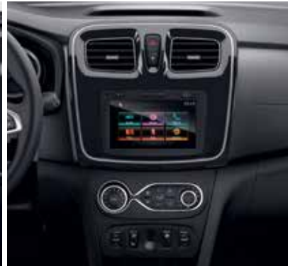
Planșă de bord