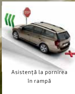
Asistență la pornirea în rampă