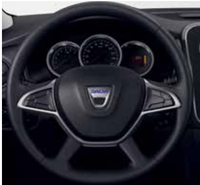
Volan cu patru brațe

Modulabil și funcțional, breakul Dacia nu rămâne mai prejos nici la capitolul confort, atât pentru șofer, cât și pentru pasageri. Spațiile generoase de depozitare te ajută să-ți organizezi mai bine călătoriile: pe consola centrală am inserat un compartiment pentru telefonul mobil, iar în partea laterală, am adăugat un buzunar care poate stoca diverse obiecte personale. Pasagerii din spate au acum la dispoziție un spațiu pentru sticle sau pahare și își pot încărca dispozitivele mobile cu ajutorul unei prize de 12V.