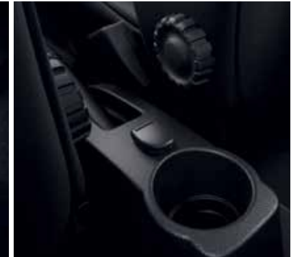
Priză de 12V