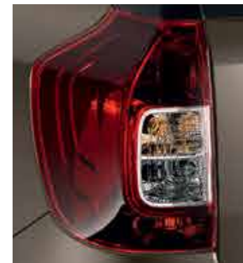
Blocuri optice redesenat