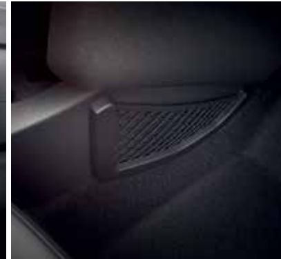
Buzunar de depozitare