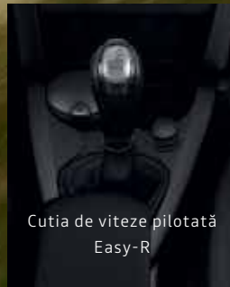
Cutia de viteze pilotată Easy-R