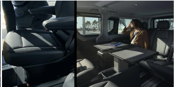
Business trip? Ai tot ce iti trebuie pentru a iti desfasura activitatea pe parcursul calatoriei: priza pentru laptop, mufa USB pentru incarcarea telefonului mobil, sala de sedinte, scaune confortabile si o capacitate de pana la 5 locuri pe randurile 2 si 3