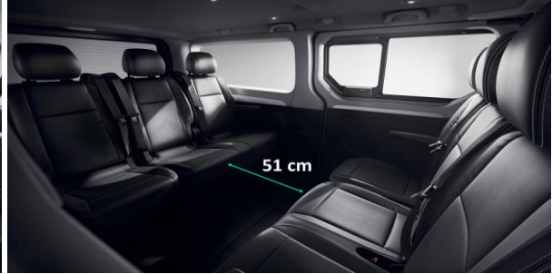
Adaptabilitate: bancheta cu 3 locuri de pe randul 2 poate fi repositionata astfel incat pasagerii sa poarte conversatii fara sa depuna prea mult efort