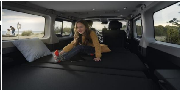
Ai avut o saptamana grea in care Spaceclass ti-a servit drept birou, sala de sedinte sau locul unde ai servit masa in tihna? Weekend-ul este aici si familia doreste sa evadeze din mediul urban? Cu pachetul Escapade transformi Spaceclass-ul din birou in rulota si evadezi din cotidian.