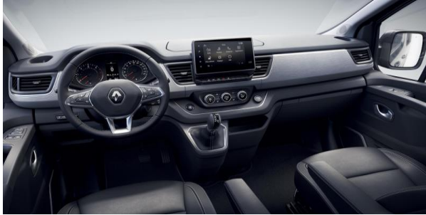
Design bord unic Spaceclass