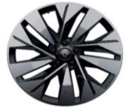
design Sonic techno