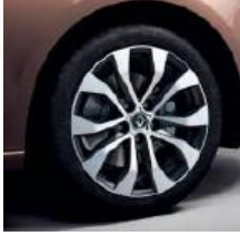
Jante aliaj 17" design Allium