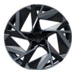
Jante aliaj 19", design esprit Alpine (RALU19/RDIF16)