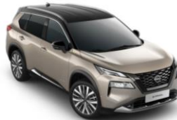
Imaginile cu titlu de prezentare: ePOWER Tekna Plus