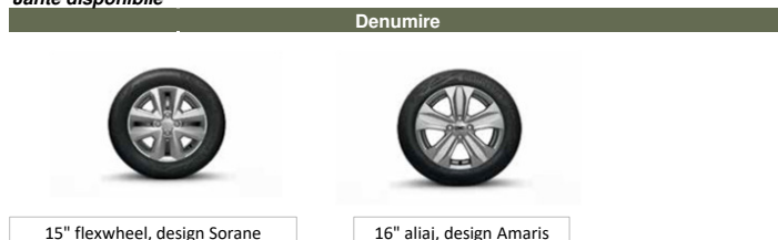
15" flexwheel, design Sorane