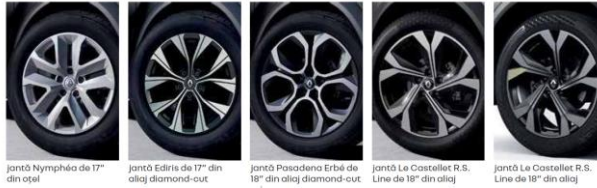
jantă Nymphéa de 17" din oțel