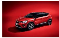
ROUGE FLAMME & BLACK BIXPA : NNP + GNE