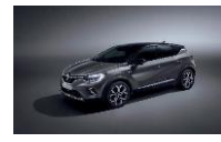
GREY CASSIOPE & BLACK BIXNK : KNG+GNE