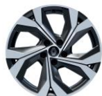
Jante aliaj 18" (RALU18/RDIF12)