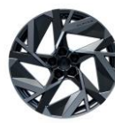
Jante aliaj 19", design esprit alpine (RALU19/RDIF11)