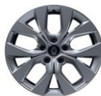
Jante aliaj 17" (RALU17/RDIF15)