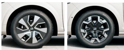
ATARA 16" Flexwheel